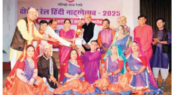
नाटक "सखी सुहाग राम मोहे दीन्हा" का मंचन करने वाली मुख्यालय टीम बनी विजेता